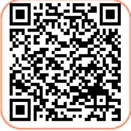
Hasar Kaydı Sorgulama

34KKS110 plakalı aracın SBM kayıtlarını aşağıdaki QR barkodlarından görebilirsiniz.