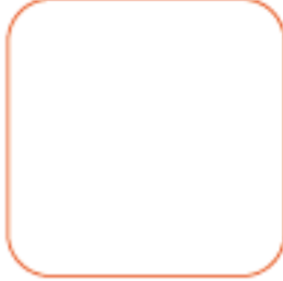
KM Kaydı Sorgulama